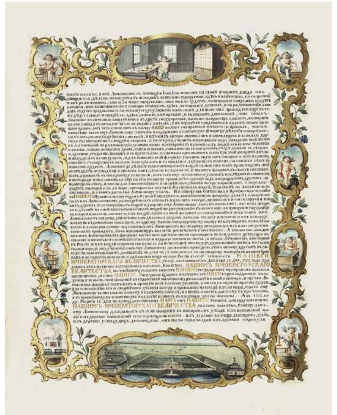
Ил. 3. Оборот титульного листа Усть-Рудицкой грамоты. 1756. СПФ АРАН