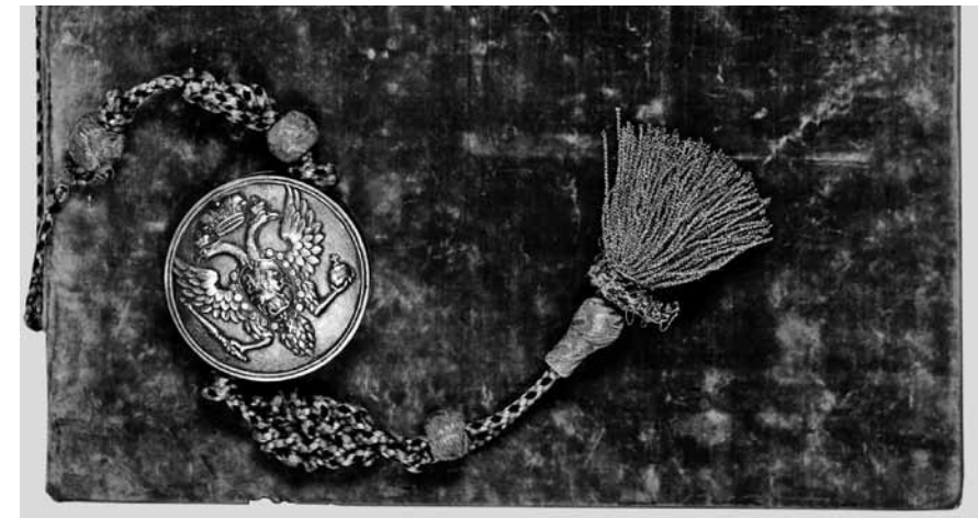
Ил. 1. Внешний вид Усть-Рудицкой грамоты. 1756. Фрагмент.

Титульный лист переполнен государственной символикой и эмблемами, которые отображают успехи России на военном, морском, торгово-экономическом и научном поприще. Сверху в центре помещен поясной портрет Елизаветы Петровны, обрамленный рамкой в рокайльном стиле. Портретная рама увенчана большой императорской короной. Императрица изображена в серебряном парчовом коронационном платье, украшенном вышивкой из драгоценных камней, с орденом Андрея Первозванного на груди и синей муаровой орденской лентой через плечо, в горностаевой мантии;