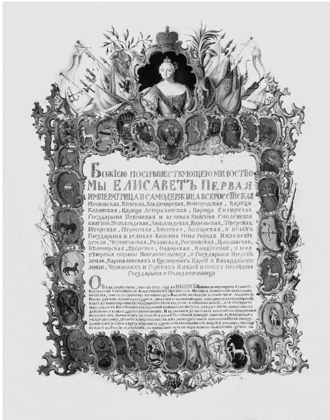
Ил. 2. Титульный лист Усть-Рудицкой грамоты. 1756. СПФ АРАН (см. цв. иллюстрацию на с. 284)

табурет с зеленой бархатной подушкой, на которой лежит золотой дворянский венец); пермский (в алом поле идущий медведь, несущий на спине Евангелие с золотым крестом); болгарский (в зеленом поле «зверь темной масти», левой лапой держит красную хоругвь на золотом древке); черниговский (в серебряном поле черный орел с золотой короной, в левом когте держит перед собой длинный золотой крест). С правой стороны изображены гербы (сверху вниз): смоленский (в серебряном поле золотая пушка на зеленом грунте, с сидящей на ней райской птицей); югорский (в серебряном поле из голубых облаков простираются две руки, держащие крест-накрест две пики, обращенные верхними концами вверх); вятский (в золотом поле простирается из тучи правая рука, держащая золотой лук с натянутой красной стрелой, над концом стрелы изображен алый крест); нижегородский («Новгородский низовской земли»: в белом поле красный олень с черными рогами и ногами); рязанский (в золотом поле князь в княжеском венце и пурпуровой мантии, в правой руке держащий обнаженный меч).