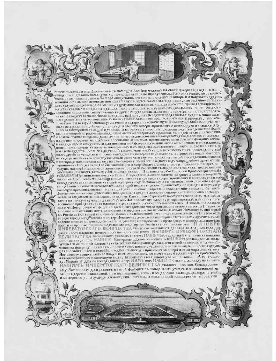
Ил. 3. Оборот титульного листа Усть-Рудицкой грамоты. 1756. СПИФ АРАН (см. цв. иллюстрацию на с. 285)