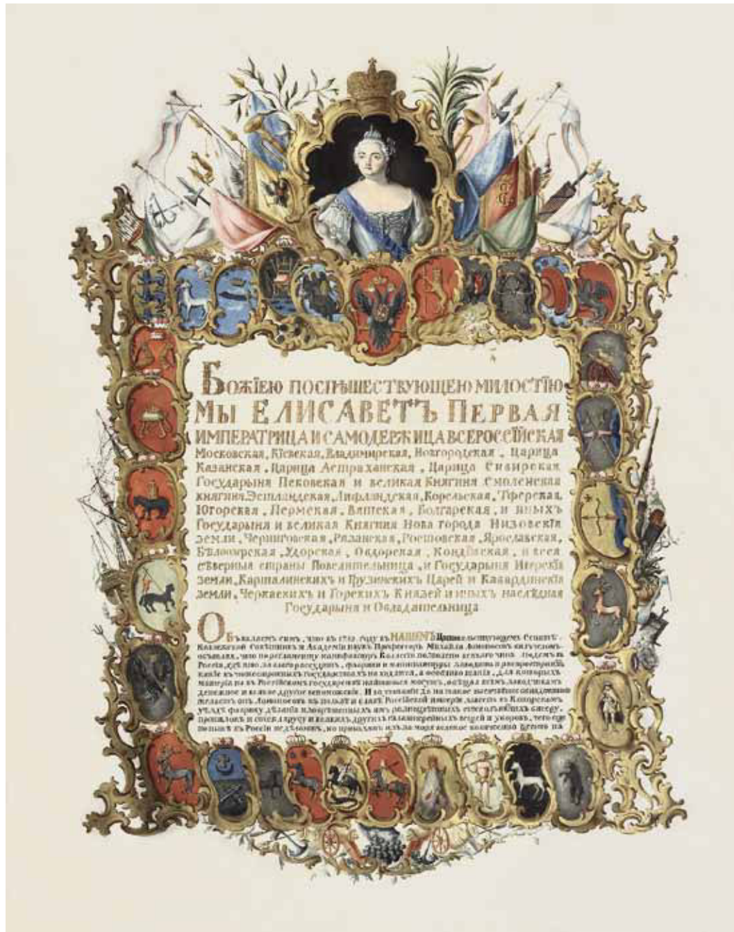
Ил. 2. Титульный лист Усть-Рудицкой грамоты. 1756. СПФ АРАН