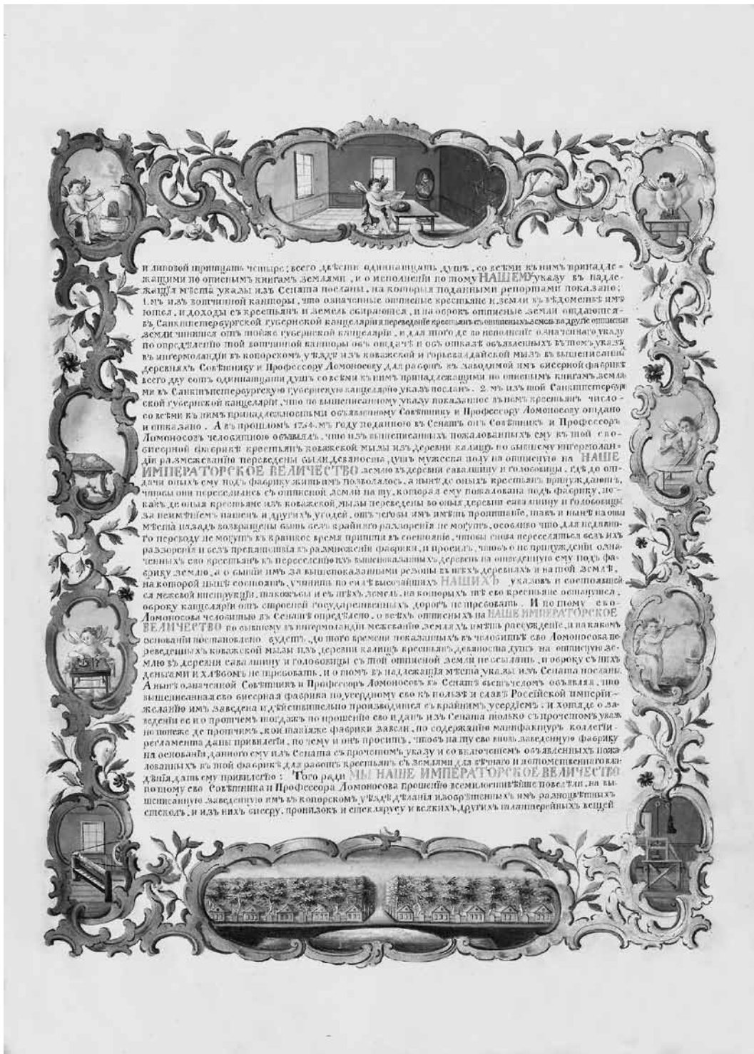
Ил. 4. Второй лист Усть-Рудицкой грамоты. 1756. СПФ АРАН